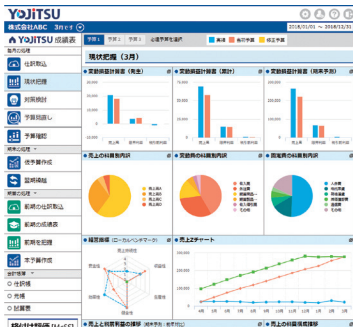
※開発中の画面となります。