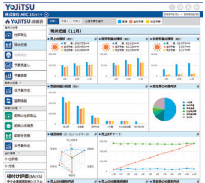
※開発中の画面イメージです。